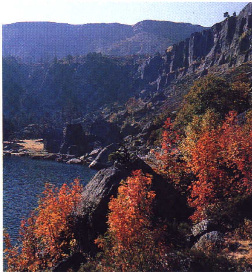
Ca. Laguna Negra, España

El número de casas catalogadas en esta villa es de tres, todas de gran belleza y pertenecientes al tipo conocido como casona carretera. Las tres han sido restauradas y se encuentran en buen estado de conservación, y además de funcionar como una vivienda moderna con todo tipo de comodidades, mantienen intacto su aspecto exterior, dando al pueblo el encanto y la magia de un auténtico pueblo carretero.