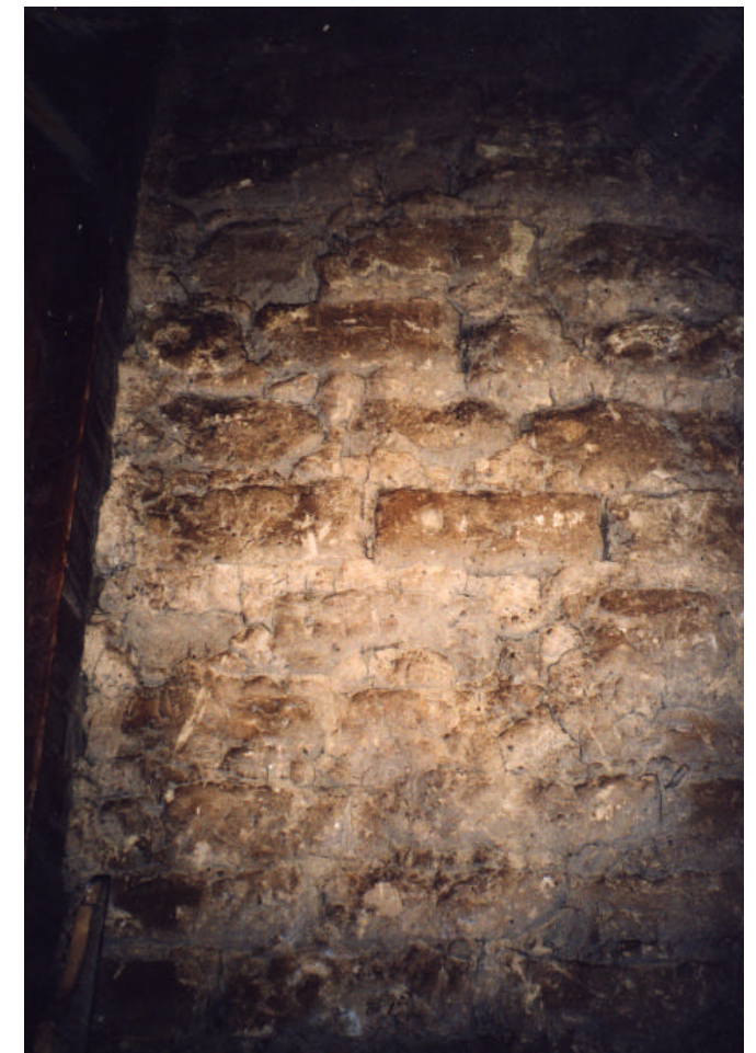
Cerramiento. Vista interior.

Coronando los muros perimetrales aparecen unas vigas de madera arriostradas en las esquinas con vigas que unen a todo el conjunto. Desde las cuatro esquinas del edificio parten las vigas de madera que marcan las limetasas y que se unen en la citada cúspide apoyándose en el centro en la estructura auxiliar comentada anteriormente.