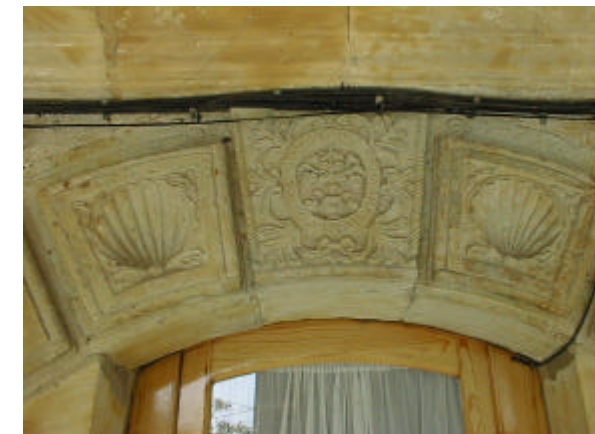
Detalle del decorado de las dovelas del arco

- FACHADAS SECUNDARIAS: Actualmente, se encuentran muy modificadas, pero se aprecia que las fachadas laterales son de