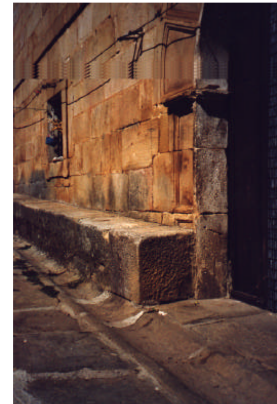
Poyo de piedra en fachada principal

Las escaleras son de madera en todo su recorrido, salvo el primer tramo que parte del zaguán, en el que las cuatro huellas y el descansillo son un macizado de piedra.