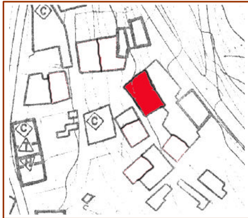
CASA Nº 14