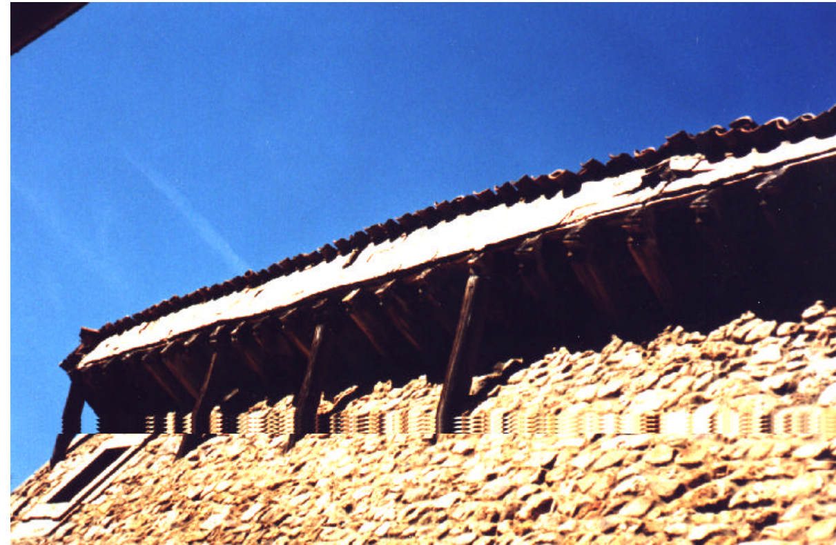
Reforma del alero lateral izquierdo.

Son las habituales: caja general de protección, una farola, cableado de tendido eléctrico, placa de numeración, placa con el nombre de la calle y alambres a modo de tendedero.