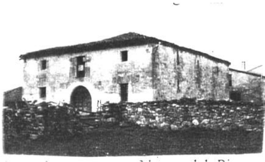
Casona carretera desaparecida. Navas del Pinar.

Pequeños pueblos como Aldea y Navas del Pinar pertenecen también a este ayuntamiento.